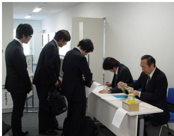
写真-1 会場受付の様子

また、発表していただいた方に対して、今後の励みとなるよう優秀発表者を選出し、発表会後の懇親会で、表彰を行いました。