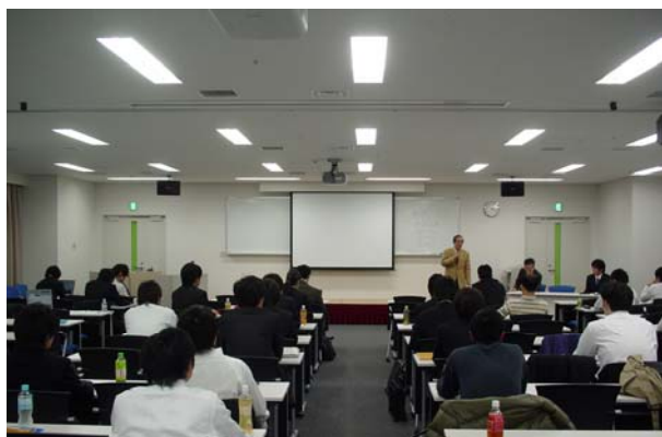
写真-2 満員の会場の様子